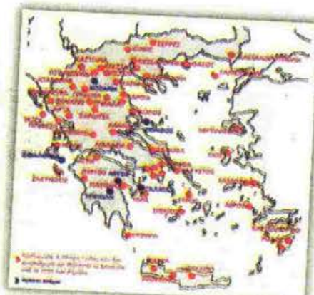
Τα σημεία προσφοράς πανελλαδικά