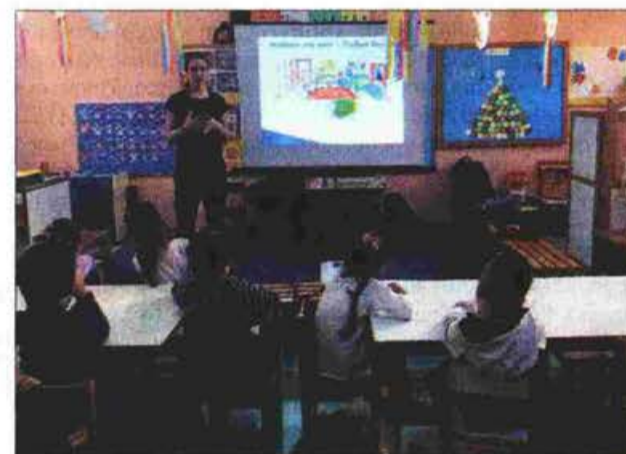
Μαθήματα πρόληψης των ατυχημάτων σε παιδιά