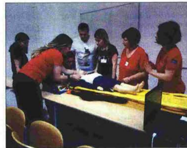
Φωτογραφίες από ιατρικά σεμινάρια για αντιμετώπιση επειγόντων περιστατικών σε παιδιά