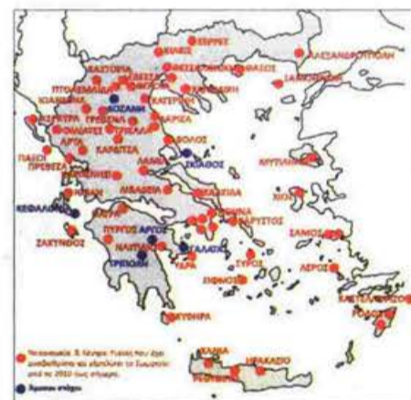
Χάρτης με τα σημεία που έχει προσφέρει η Αντιμετώπιση Παιδικού Τραύματος